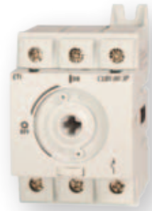
CLBS 16 3p

Prednji pogon (sa direktnom i produženom ručicom) i pogon sa desne strane